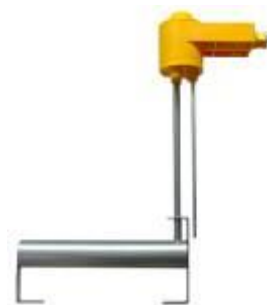
Winkel- Badwärmer mit Thermostat