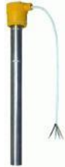
Überhitzungsschutz/ Brandschutz Badwärmer