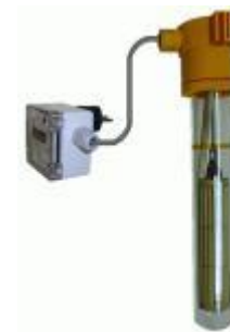
Thermostat gesteuerte Badwärmer