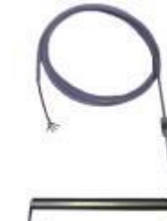
Winkel-Tankheizkörper m. flex. Senkrechten Schenkel