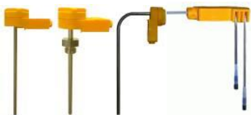
Einschraubbare, Einschweissbare PT 100, PTC, Temperaturfühler mit integrierter Stromschleife, Analog-Linear Temperatur/Spannungswandler usw.