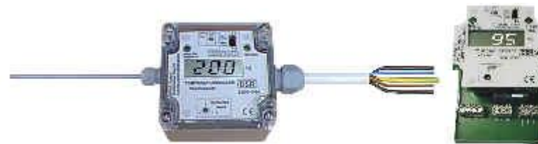
Digitaler Temperaturregler mit flexiblem PTFE-Fühler Digitaler Temperaturregler für Schnappschiene Digitaler Temperaturbegrenzer mit flexiblem PTFE-Fühler Digitaler-Temperaturbegrenzer für Schnappschiene