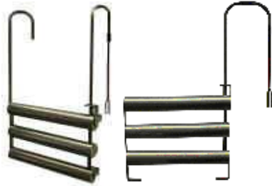
Hochleistungs-Einhänge und Stand-Tauchregister