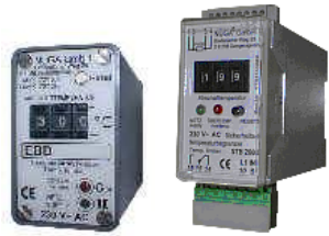
Digitaler, Sicherheits-Temperaturbegrenzer auch TÜV geprüft für Schnappschiene