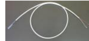
Pt-100, PTC Temperatur-fühler im flex. Teflonschlauch