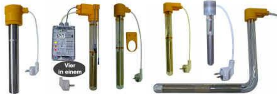
Isolator-Tauchbadwärmer Vollautomatische Kleinbadwärmer Kleinbadwärmer Mini-Kleinbadwärmer Glaswinkel