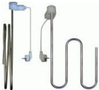
Titan- und Edelstahl-Heizstäbe