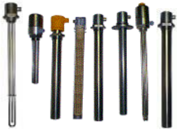
Einschraub-Flansch-Heizkörper mit Gew.-Nippel usw.