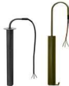
Wasserdichte Hochtemperatur Badwärmer