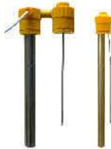
Badwärmer mit Stabtemperaturregler