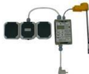
Vollautomatische Badwärmer- Steuergeräte