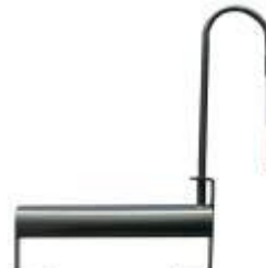
Winkel-Heizstab mit biegsamem Schenkel