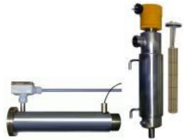
Lufterhitzer z.B. für Leiterplatten-Anlagen. Durchlauferhitzer