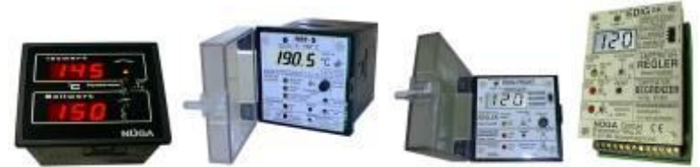
Digitale Temperaturregler, - Begrenzer,-Trockenheizschutz, Niveau und Überfüllschutz, zusätzl. mit Alarm, Pumpe, Heizen/ Kühlen, 2 Punkt, 3 Punkt. In Sonderausführung auch für Brünierbäder mit Timerfunktion. Schalttafel-und Schnappschieneinbau.