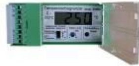
Digitaler Temperaturbegrenzer mit Trockenheizschutz und Überfüllsicherung