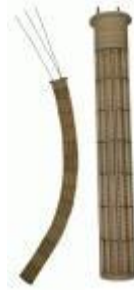
Keramische Patronenheizkörper mit Bolzen-oder Litzenanschluss, in gerader oder biegsamer Ausführung.