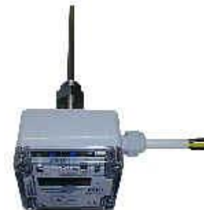
Einschraubbarer Temperaturregler Temperaturbegrenzer