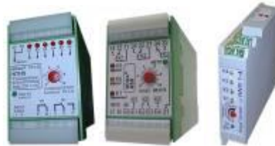
Niveaurelais für Trockenheizschutz, Niveau ( Entleeren/Befüllen), Überfüllsicherung, auch für Schwimmerschalter verwendbar, für Schnappschiene oder Stecksocket. )