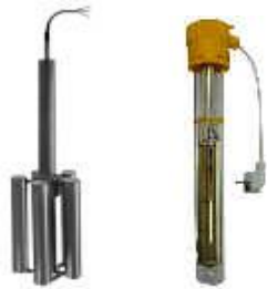
Stern-Tankheizkörper Tauchbadwärmer in Normalausführung Universal-Tauchbadwärmer