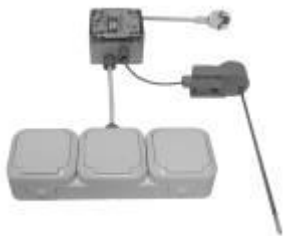
Thermostat gesteuerte Badwärmer- Steuergeräte